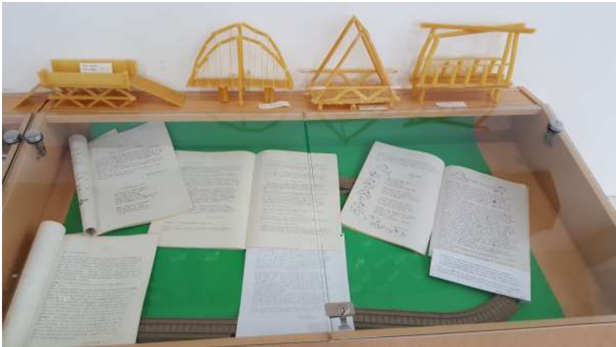
Izdelki učencev, ki jim je bila razstava navdih, šol. leto 2016/17