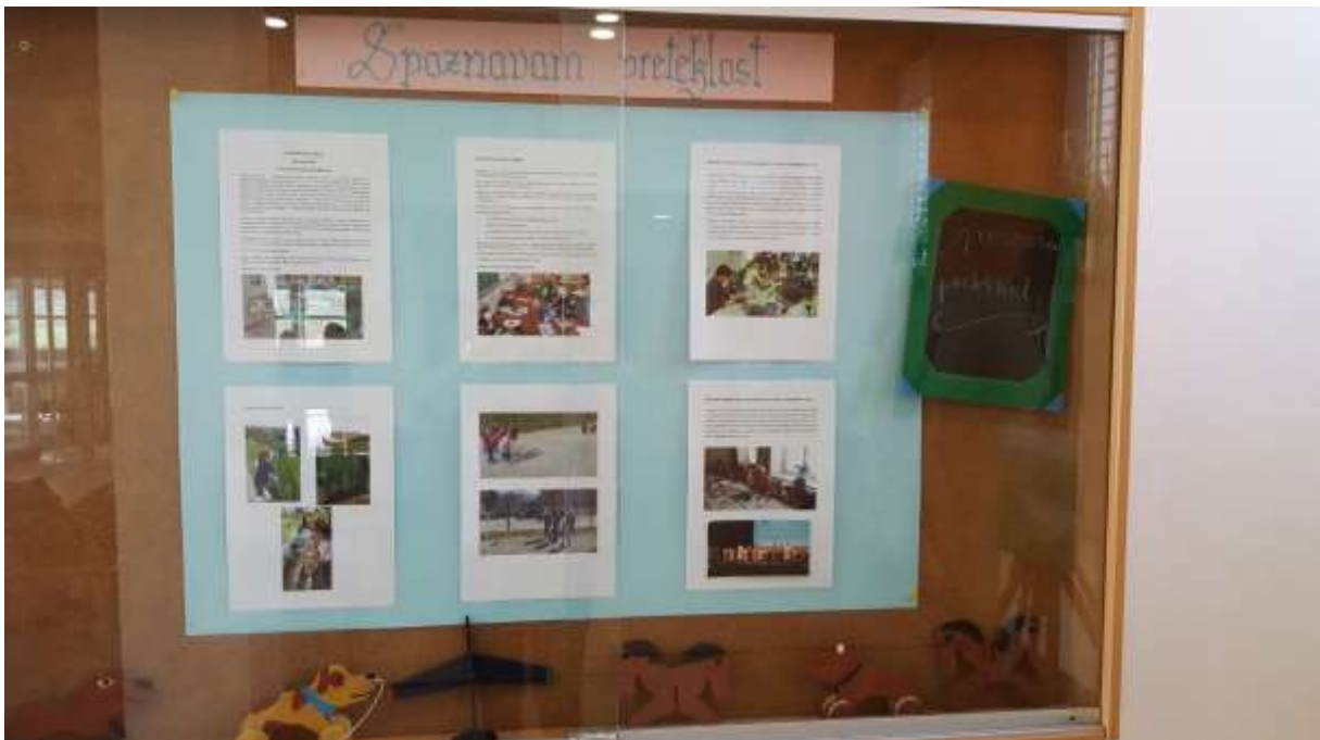
Utrinki iz projekta Spoznavam preteklost ...