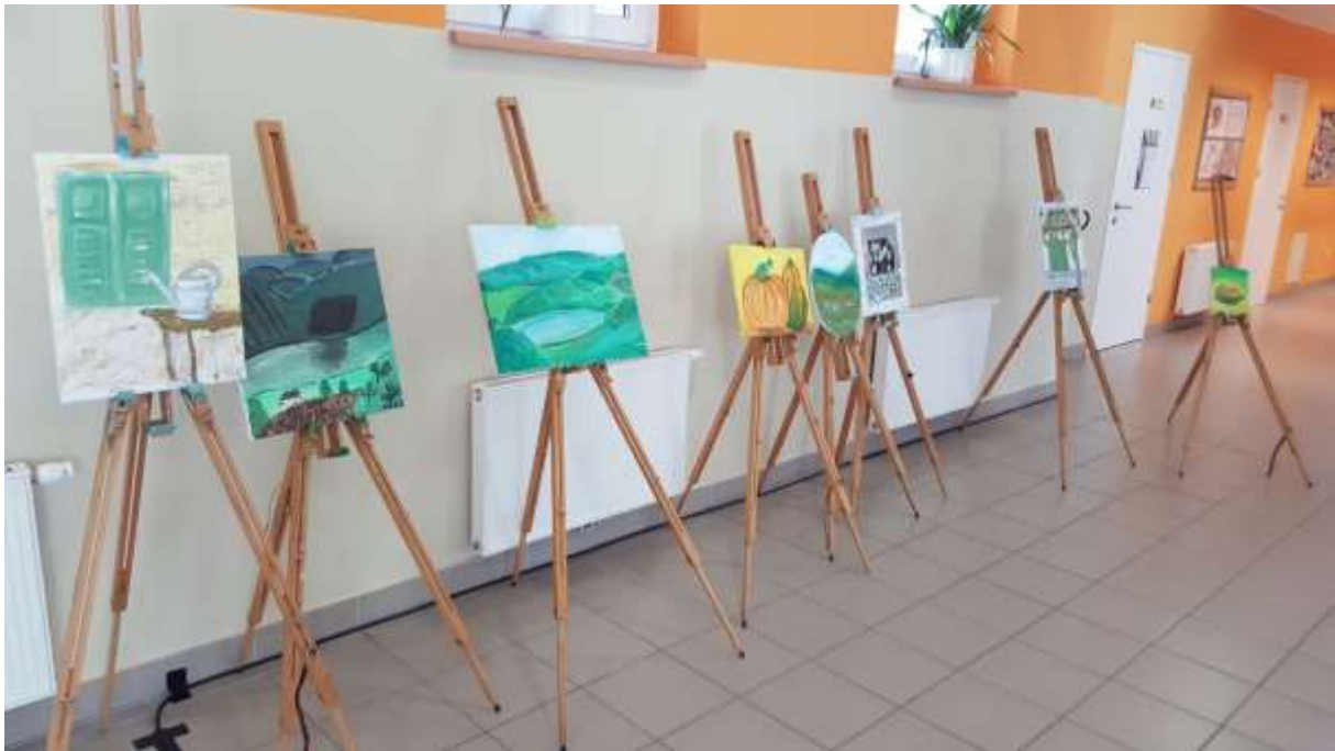
Razstava likovnih izdelkov Po poteh Ferdinanda Maliča