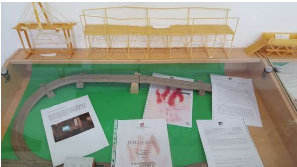
Pesniški viadukt iz špaget in na zgodovinskem simpoziju