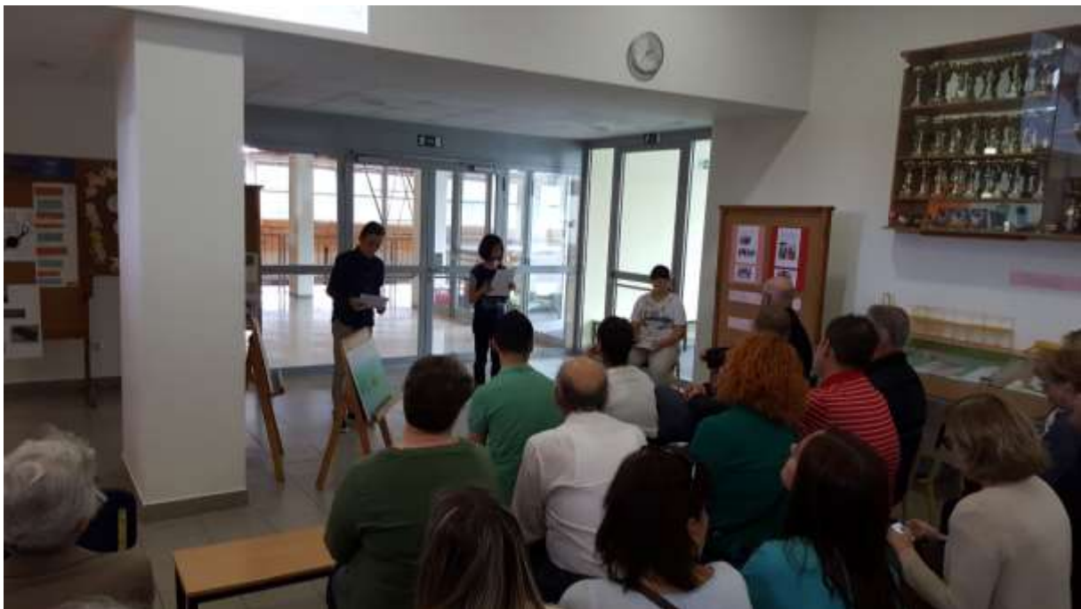
Otvoritev razstave Podobe našega kraja – Pesnica skozi čas, Pesnica, 17. 5. 2017