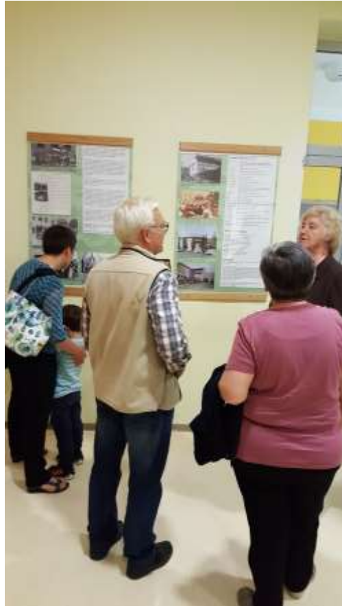
Razstava v prostorih OŠ Pesnica, 17. 5. 2017